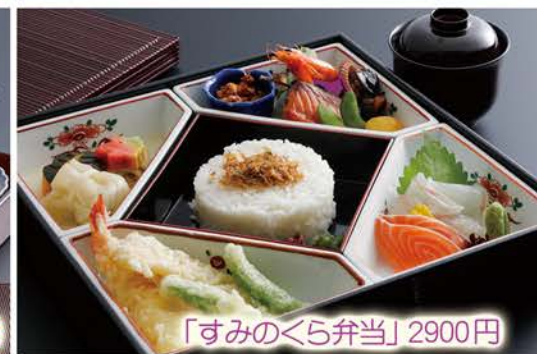
「すみのくら弁当」2900円