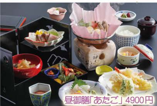
昼御膳「あたらご」4900円